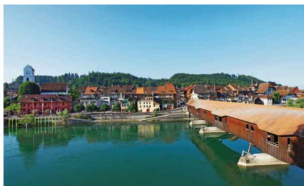
Büren an der Aare