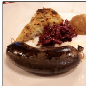
Boudin et röstis