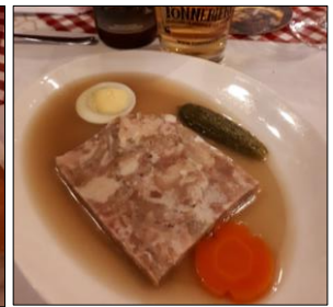
Gelée de ménage