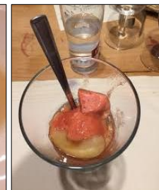
Sorbet à la Damassine

A Porrentruy , la foire de la St-Martin s'amplifie d'animations locales et de dégustations toutes plus cochonesques. Un marché animé (et surtout animal !) envahit la Grand-Rue dans une tempête de charcutailles : rôtis, bouillis, choucroutes, saucissons, etc. Il ne manque plus que la fondue au saindoux ! Des festivaliers déguisés en cochon, des cochons déguisés en saucisses et des saucisses déguisées en andouilles. Une truie n'y retrouverait pas ses petits ! (AS)