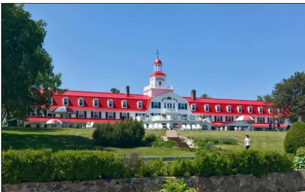
L'Hôtel Tadoussac semble tout droit sorti d'une autre époque

Tadoussac a longtemps été un comptoir de traite de la Nouvelle-France et un lieu de commerce de fourrures avec les Amérindiens, avant l'arrivée des missionnaires jésuites décidés à évangéliser les « Sauvages ». L'agriculture et l'exploitation du bois se sont ensuite imposées, puis les premiers touristes sont tombés sous le charme des lieux et la luxuriance de son environnement. Même les baleines viennent s'y reposer. Tadoussac est l'un des plus beaux villages du Québec et membre du club fermé des « plus belles baies du monde » !