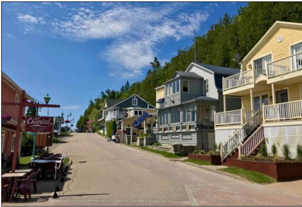
La Malbaie Pointe-au-Pic

A l'embouchure du majestueux fjord du Saguenay, Tadoussac est un bastion historique où Jacques Cartier jeta l'ancre en 1535. A cet endroit, le St-Laurent forme déjà le plus grand estuaire du monde avant de terminer sa course dans l'océan Atlantique à quelques 370 kilomètres de là.